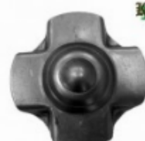
Декоративный колпачок, арт. 8.921 д=78x1,5мм Вес: 0.06 кг Цена: 30 руб.