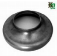
Переходник на трубу, арт. 8.15989