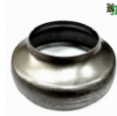
Переходник на трубу, арт. 8.10876