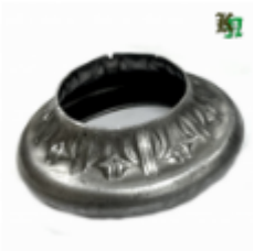
Переходник на трубу, арт. 8.876