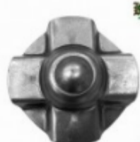
Декоративный колпачок, арт. 8.922 д=75x1,5мм Вес: 0.06 кг Цена: 20 руб.