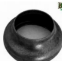
Переходник на трубу, арт. 8.7657 д=76мм, переход на д=57мм Вес: 0.23 кг Цена: 109 руб.