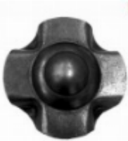
Декоративный колпачок, арт. 8.924 д=45x1,5мм Вес: 0.02 кг Цена: 21 руб.