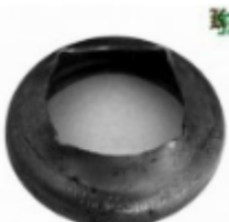
Переходник на трубу, арт. 8.1026060 д=102мм, переход на кв.60x60мм Вес: 0.31 кг Цена: 150 руб.