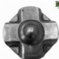
Декоративный колпачок, арт. 8.925 д=45x1,5мм Вес: 0.02 кг Цена: 17 руб.