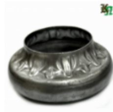
Переходник на трубу, арт. 8.877