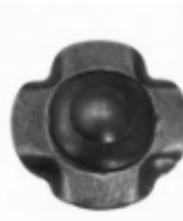
Декоративный колпачок, арт. 8.929 д=45x1,5мм Вес: 0.018 кг Цена: 16 руб.