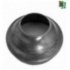
Переходник на трубу, арт. 8.8942