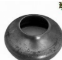
Переходник на трубу, арт. 8.7642 д=76мм, переход на д=42мм Вес: 0.23 кг Цена: 110 руб.