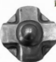
Декоративный колпачок, арт. 8.923 д=57x1,5мм Вес: 0.03 кг Цена: 18 руб.