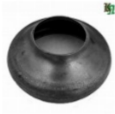
Переходник на трубу, арт. 8.10257