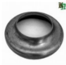
Переходник на трубу, арт. 8.159102