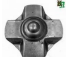
Декоративный колпачок, арт. 8.920 д=120x1,5мм Вес: 0.14 кг Цена: 60 руб.