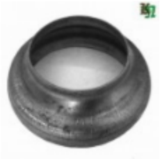
Переходник на трубу, арт. 8.10276