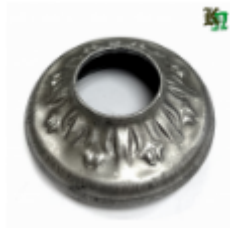
Переходник на трубу, арт. 8.5732