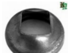
Переходник на трубу, арт. 8.764040 д=76мм, переход на кв.40x40 Вес: 0.23 кг Цена: 115 руб.