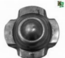
Декоративный колпачок, арт. 8.928 д=54x1,5мм Вес: 0.03 кг Цена: 20,50 руб.