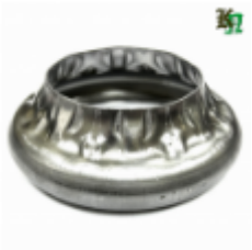
Переходник на трубу, арт. 8.883