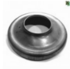
Переходник на трубу, арт. 8.15976