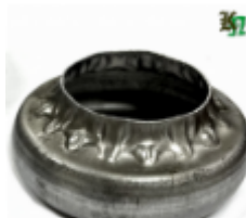
Переходник на трубу, арт. 8.878 д=76мм, переход на д=57мм Вес: 0.15 кг Цена (за шт): 123 руб.