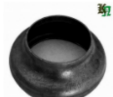
Переходник на трубу, арт. 8.5742 д=57мм, переход на д=42мм Цена (за шт): 105 руб.