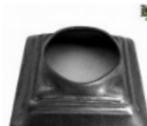
Переходник на трубу, арт. 8.808042 кв.80x80мм, переход на д=42x2мм Вес: 0.11 кг Цена: 59 руб.