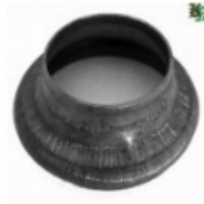
Переходник на трубу, арт. 8.8957