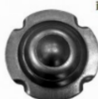
Декоративный колпачок, арт. 8.926 д=78x1,5мм Вес: 0.06 кг Цена: 25,50 руб.